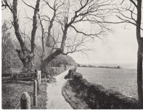
Darwins „Denkweg“ an seinem Haus in Down

Darwin fragte sich am Ende seines Lebens, warum er so erstaunlich erfolgreich hatte arbeiten können. In seiner Autobiographie notierte er: