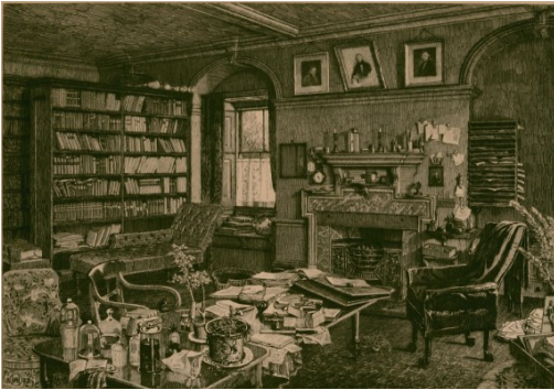
Darwins Arbeitszimmer in Down

Von seiner fünfjährigen Forschungsreise auf der „Beagle“ (1831 bis 1836) brachte Darwin eine Fülle von Eindrücken (Landschaften, Lebensweisen, Geologie) und umfangreiche Sammlungen (Fossilien, Tiere, Pflanzen) mit nach Hause, mit deren Auswertung er in den folgenden Jahren beschäftigt war, die er aber auch Fachkollegen zur Beurteilung überließ.